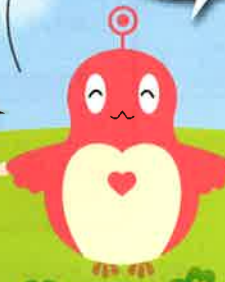
仙台市障害理解促進キャラクター 「ココロン」