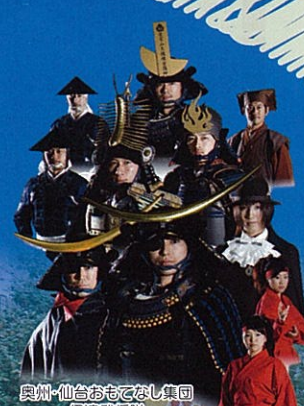
奥州・仙台おもてなし集団 伊達政宗隊