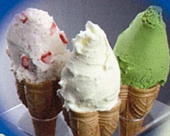
フォンテーヌ (シェラード)