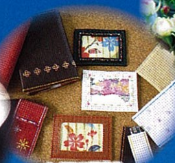
みどり正房若林 (パンチングレザー製品)