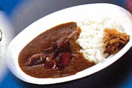
わらしべ舎 西多賀正房 (牛タンカレー)