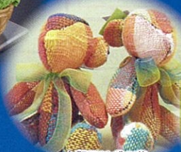
大野田はぎの苑 (機織りのテキスタイル)