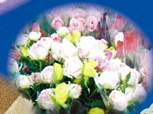
仙台ローズガーデン (バラの花束)