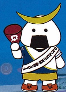
ねんりんピック宮城・仙台2012 大会マスコット「あすびん」